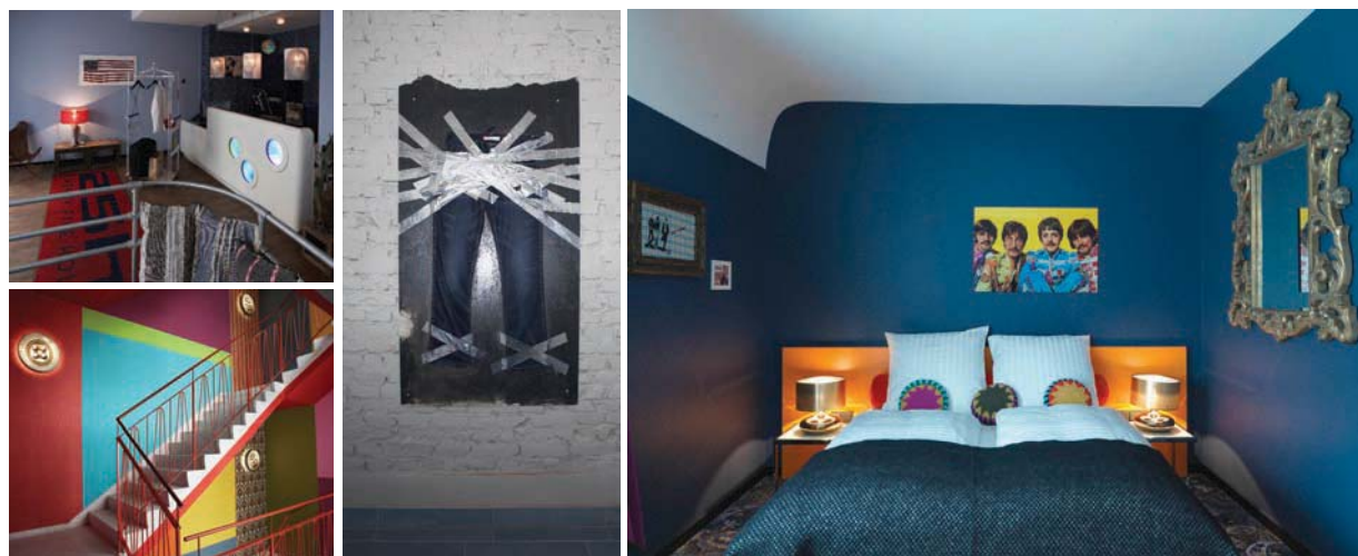
25 Hours DECORADO pela Levi's, em Frankfurt, na Alemanha, tem quartos em tamanhos M, L e XL, em diversos designs e cores