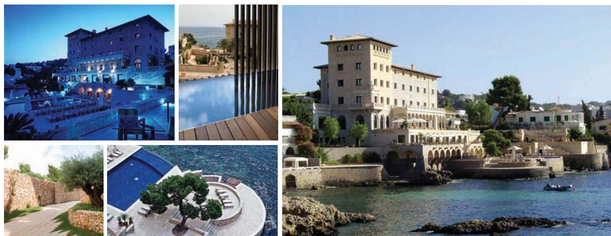
Maricel APRESENTA uma arquitectura senhorial inspirada no estilo sóbrio dos séculos XVI e XVII, com cores naturais e materiais de construção nobres, em Palma de Maiorca.

amanhecer e ao pôr-do-sol únicos. É possível optar por quartos e suites ecológicos, com piscina privada num pequeno terraço, com vista para montanha ou mar, ou optar até mesmo pela suite, que oferece vista para ambos, e se encontra decorada em materiais de madeira, pele e algodão egípcio.